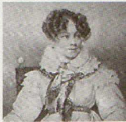
Comtesse de Ségur (1799-1874)

ON NOUS pose souvent la question: Quelle est l'origine de ce mot et sa signification? Un nom que l'on rencontre en de nombreux lieux, villages, rues et même châteaux, ainsi le Château des Nouettes, cher à la Comtesse de Ségur ?