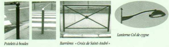
Potelets à boules Barrières « Croix de Saint-André » Lanterne Col de cygne